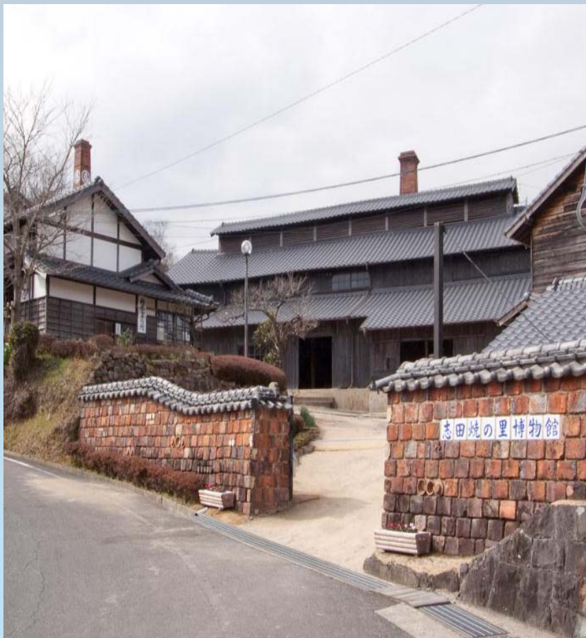
志田焼の里博物館（2005）