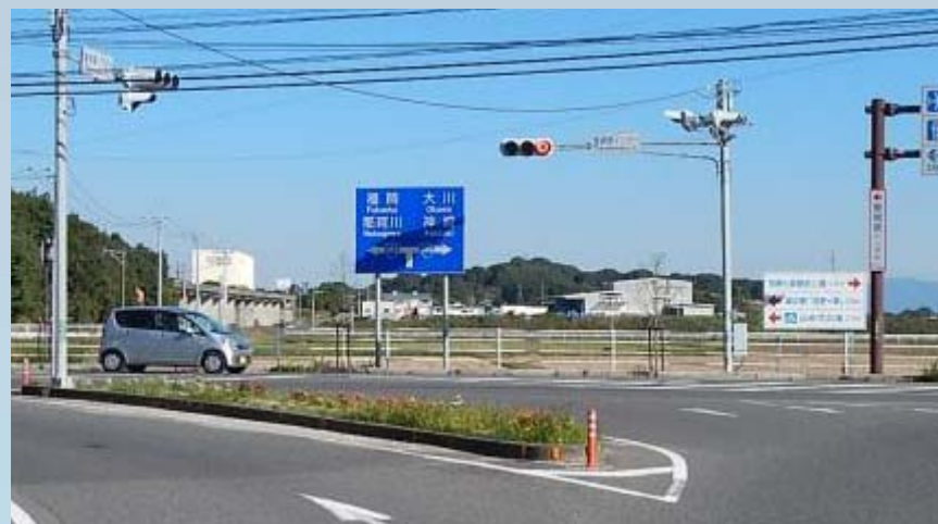
東脊振IC交差点（吉野ヶ里町）