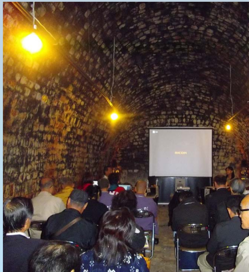
志田焼の里博物館（石炭大窯）