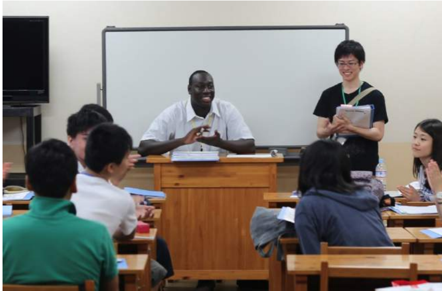
リーダー養成塾で討論