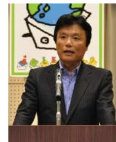
福岡県知事 小川 洋