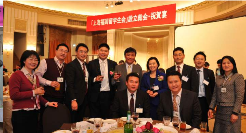
「上海福岡留学生会」設立総会(上海)