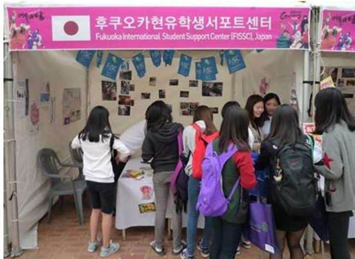
福岡留学説明会(釜山)