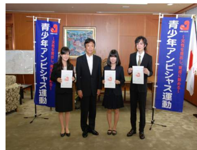
奨学生決定証交付式