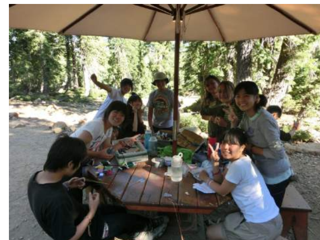
ウナライー(アメリカ)キャンプ場