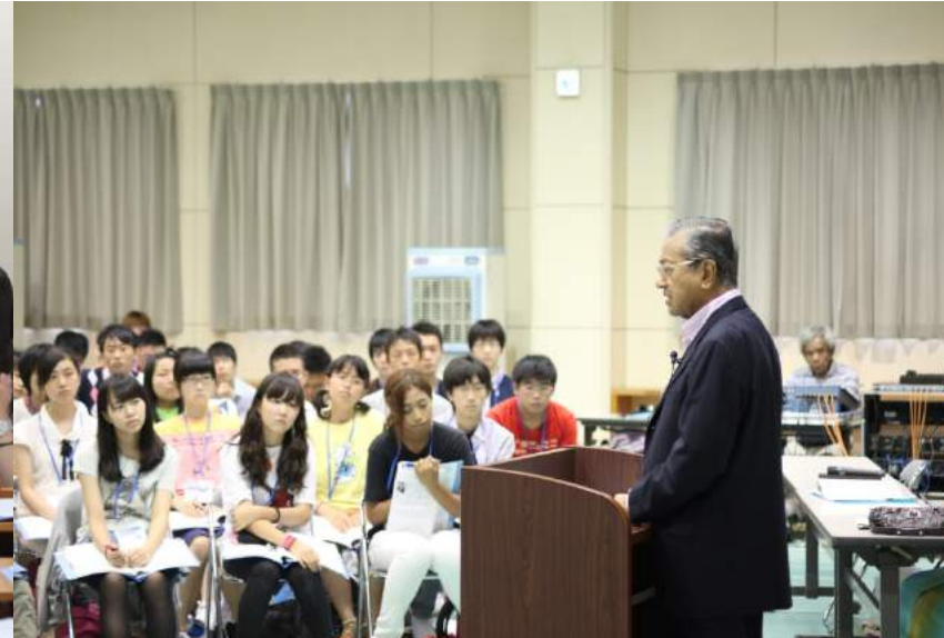
マハティール(マレーシア元首相)氏の講義