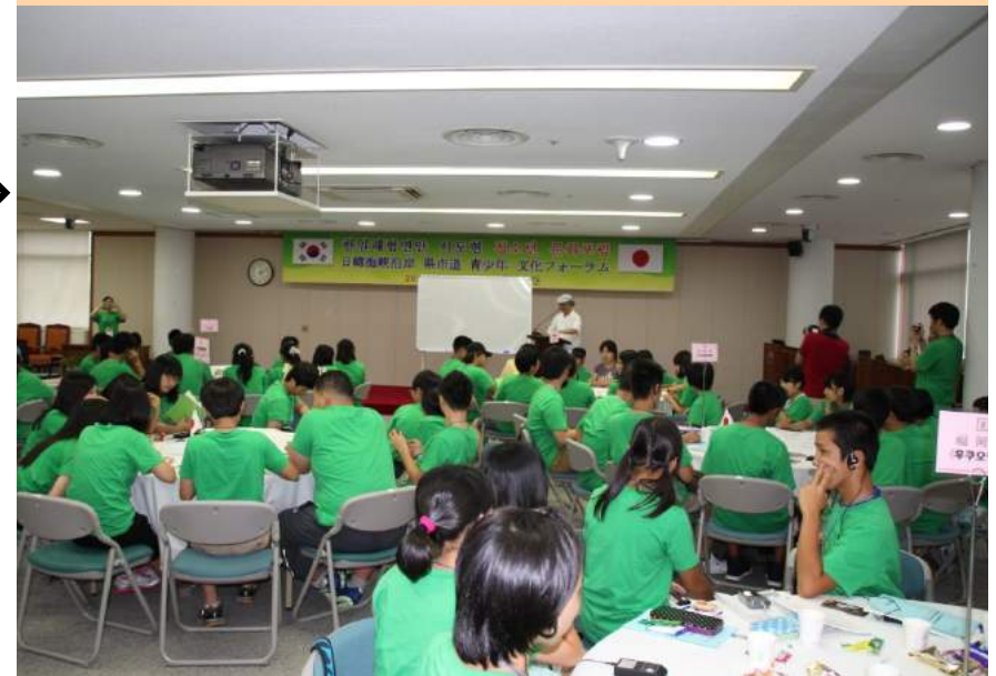
青少年文化フォーラム（2013年 於全羅南道）