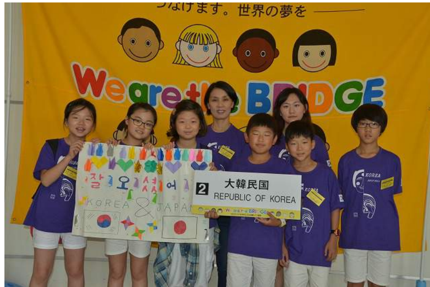
韓国のこどもたち