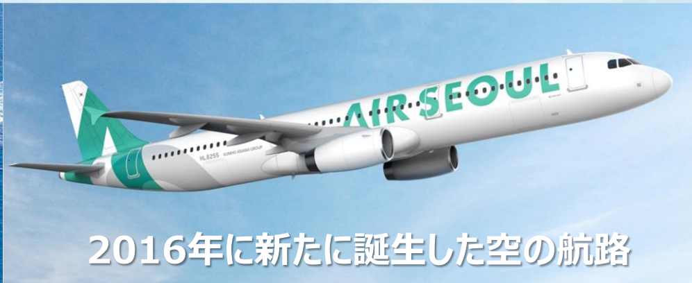
2016年に新たに誕生した空の航路