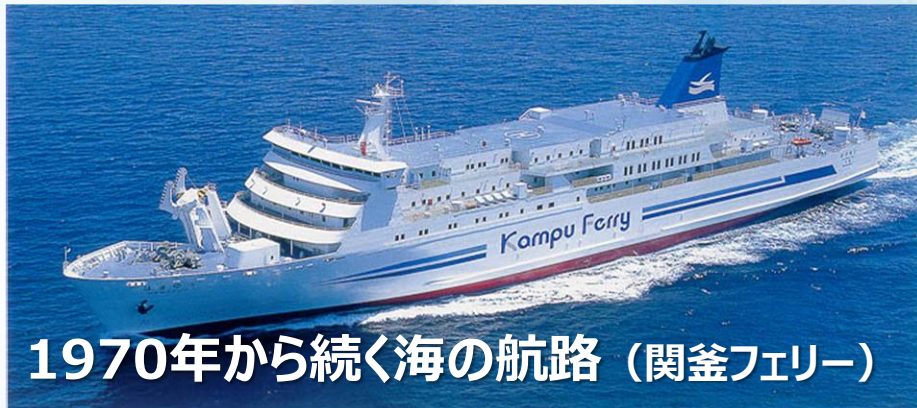
1970年から続く海の航路（関釜フェリー）