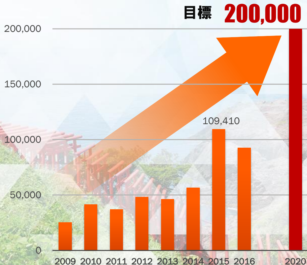
外国人宿泊者数の推移