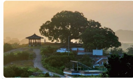
<ウ田ンウ弁護士は天才肌(昌原エソキ)>