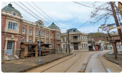
<京城スギギンダル(映画映像子母バボウ)>