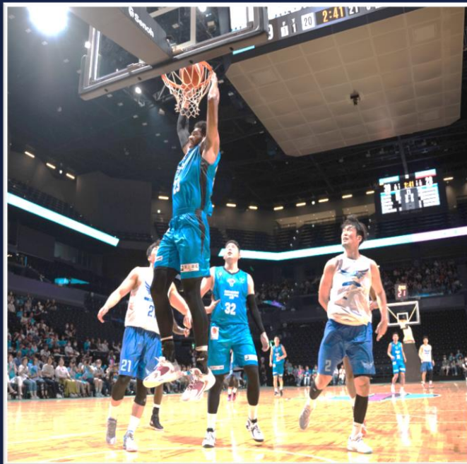
佐賀ブルーナーズ