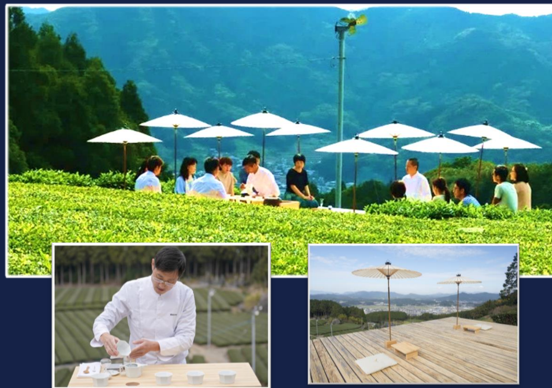
ティーツーリズム