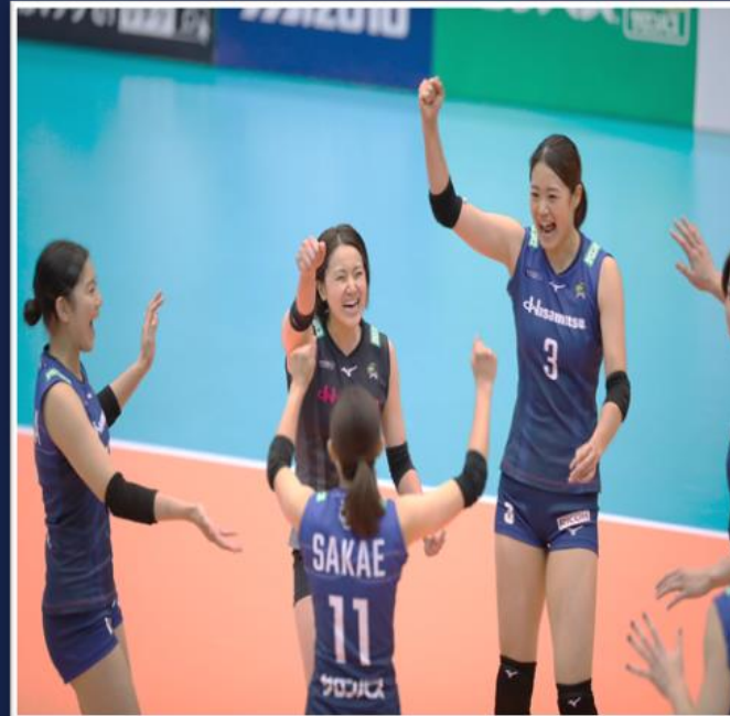
久光スプリングス