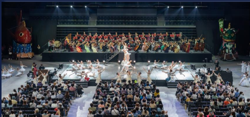
2023.6.4 With You! 佐賀県文化芸術祭