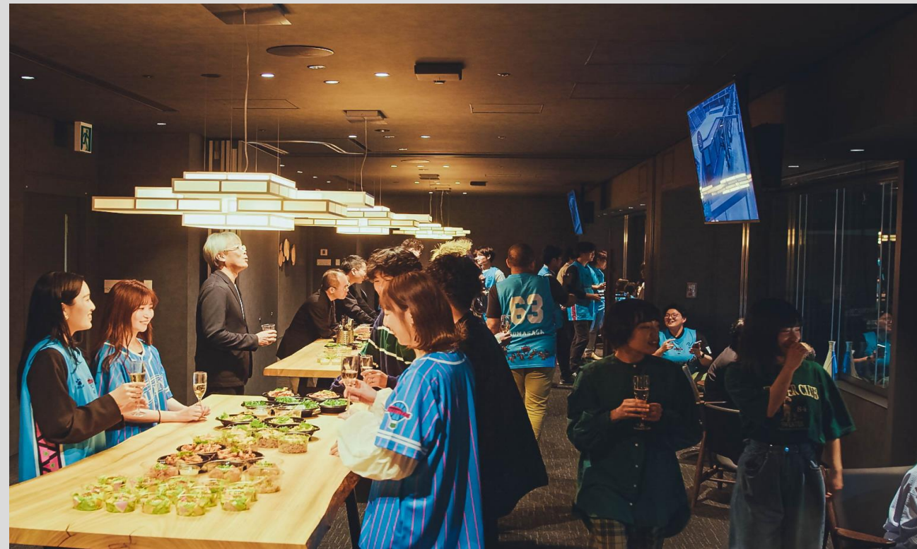
プレミアムラウンジ