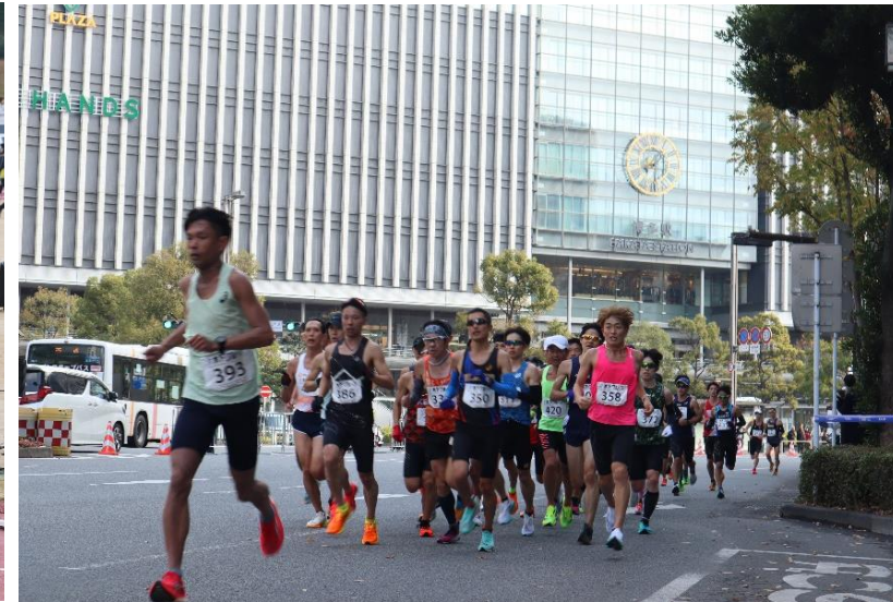
(博多駅前を通過する選手)