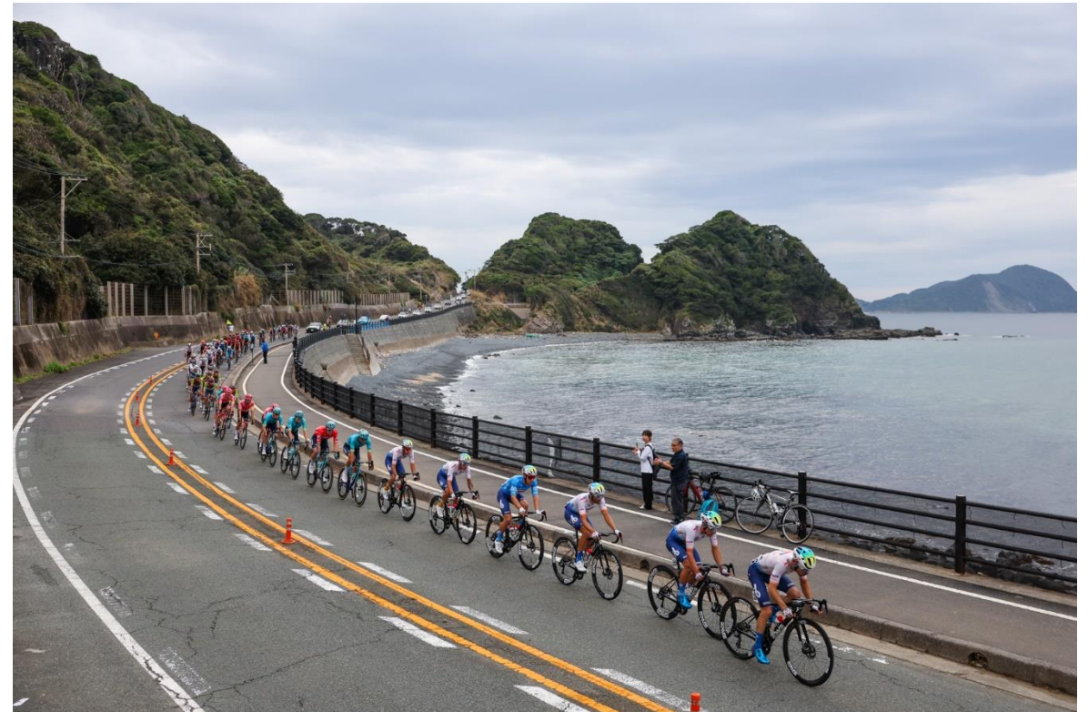
(福岡ステージの様子)