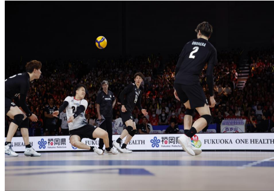
・ワンヘルスの理念の発信