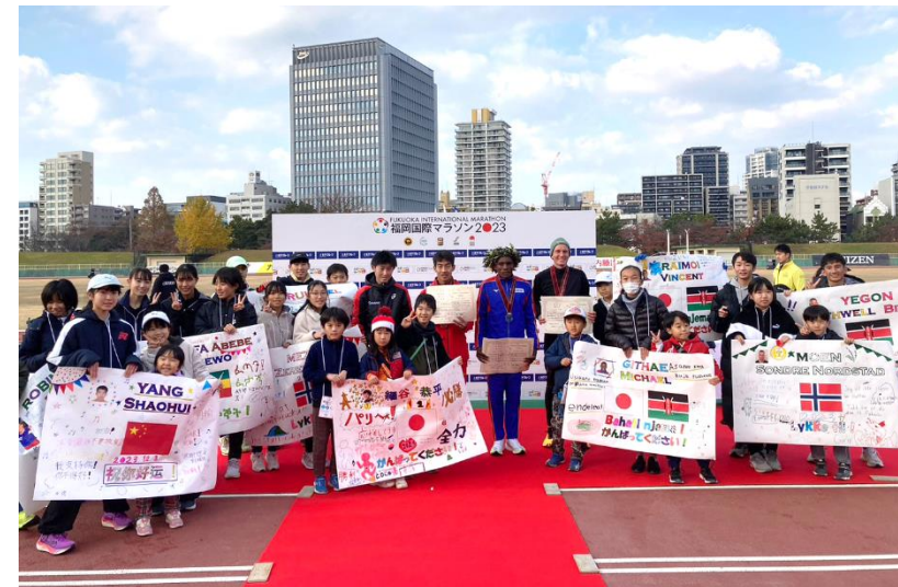
(入賞選手と招待した子ども達)