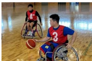
車いすバスケットボール