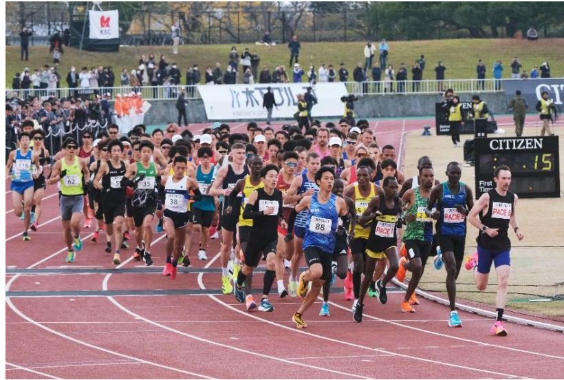
(スタートの様子(平和台陸上競技場))