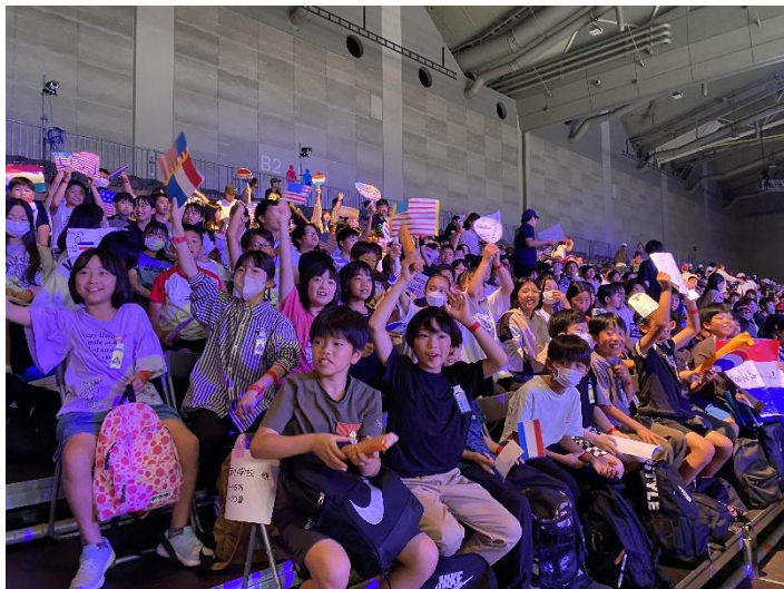
・小学生6年生1,512人を無料招待