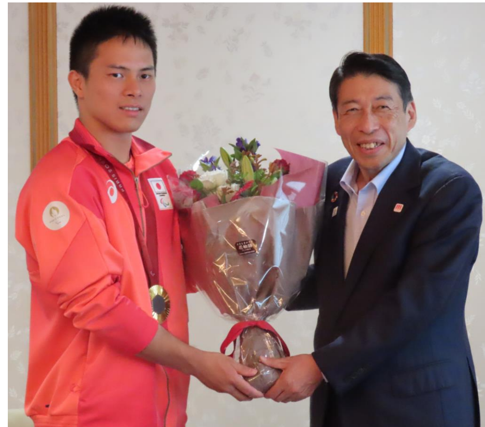
金メダル獲得報告をいただいた パラ柔道「瀬戸 勇次郎選手」