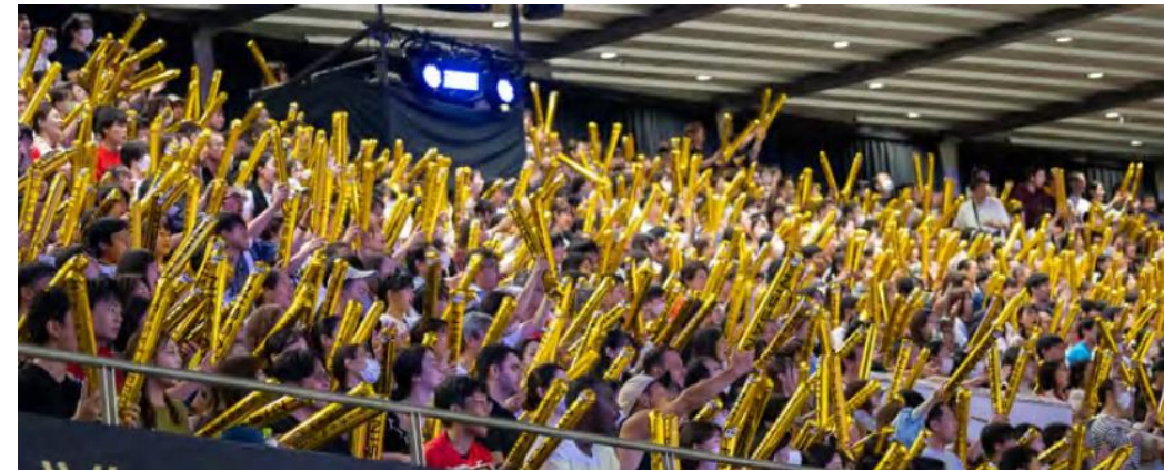
・再資源化できる素材のスティックバルーンを使用