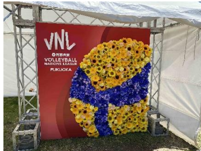
・県産花きを使用したフォトスポット