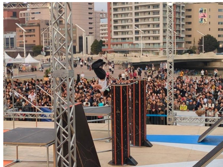
試合を観戦する観客の様子