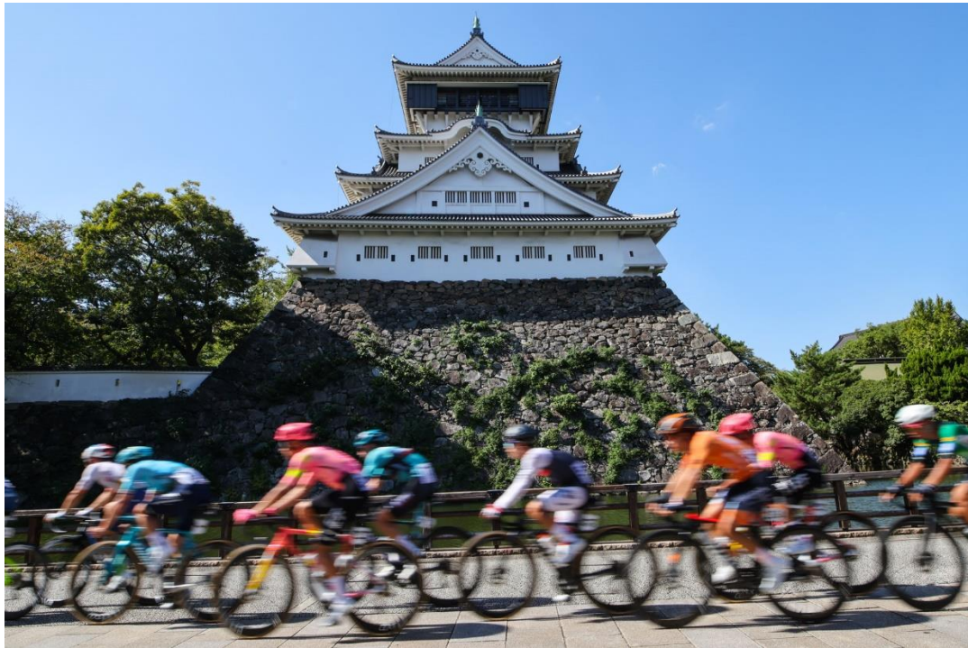
(小倉城クリテリウムの様子)